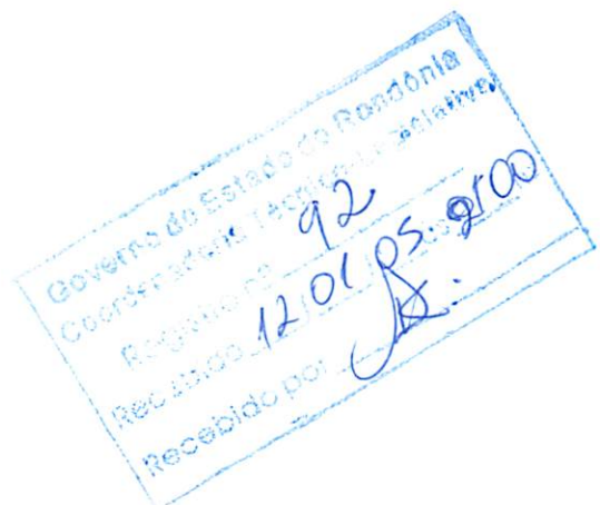
Deputado Carlão de Oliveira Presidente

ASSEMBLÉIA LEGISLATIVA, 5 de janeiro de 2005.