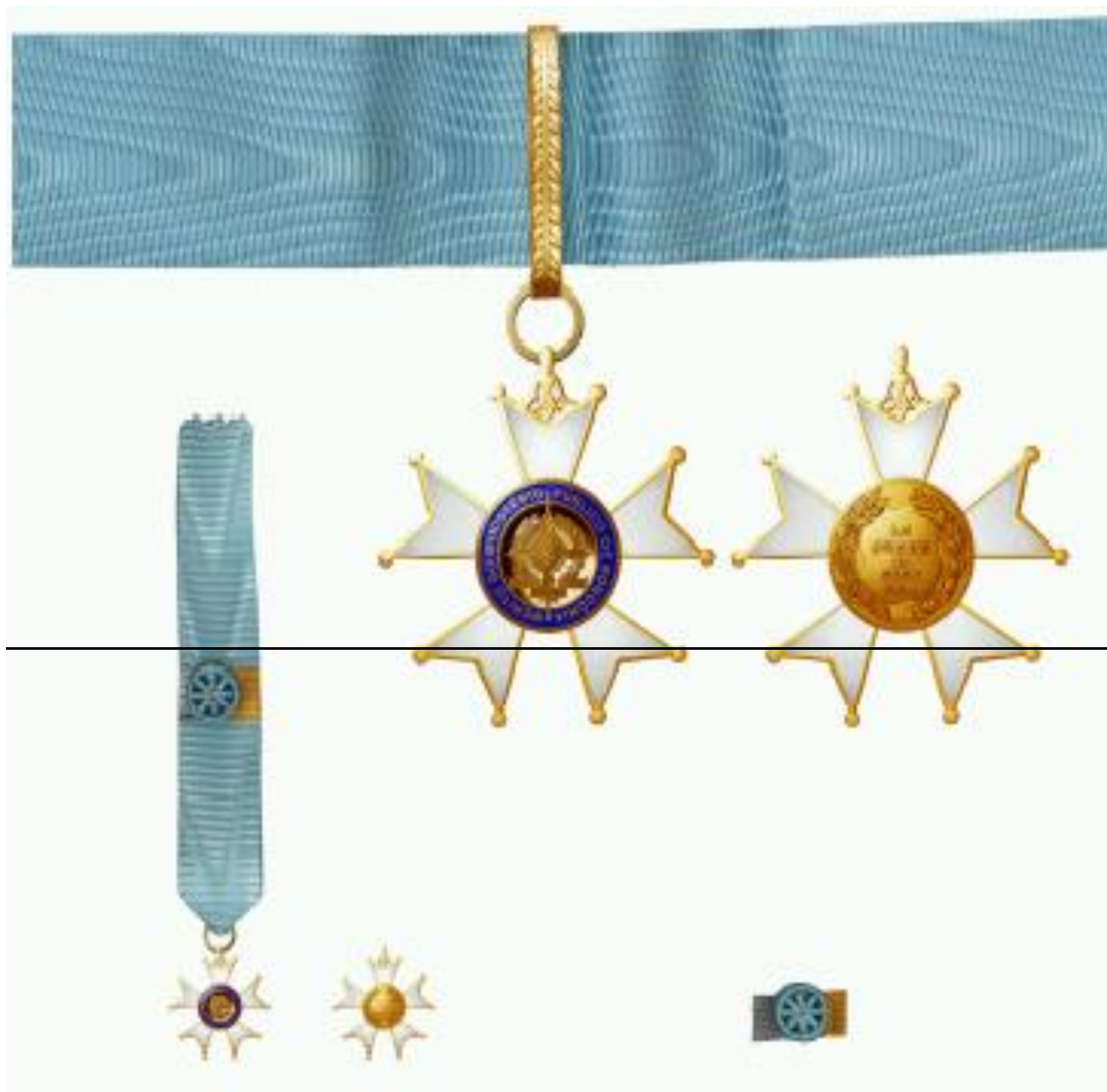
"Ordem do Mérito do Ministério Público de Rondônia"