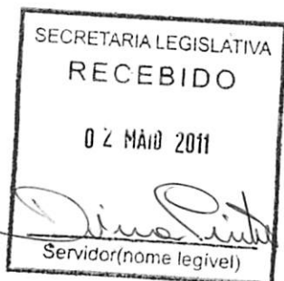
CONFÚCIO AIRES MOURA Governador

Hipócrates já mencionava lesões da boca e efetuava certos tratamentos desde a dor de dentes ao tratamento de fraturas na face. Existem registros de reduções de fraturas da face, rudimentares porém eficientes, e estes princípios foram utilizados como base para os tratamentos atuais. A cirurgia bucomaxilofacial é de âmbito ambulatorial ou hospitalar. Nos ambulatórios ou consultórios são exercidas cirurgias menores, na sua grande maioria sob anestesia local, onde são, por exemplo, removidos dentes inclusos, pequenos tumores benignos, cistos, lesões periapicais ou paradentais, implantes dentários, cirurgias para adaptações protéticas entre outras. As cirurgias de grande porte são realizadas sob anestesia geral em ambiente hospitalar e demandam maiores cuidados. São as cirurgias de grandes tumores, fraturas faciais, cirurgias ortognáticas entre outras. Na atualidade em que aumenta assustadoramente o número de casos de traumatismos faciais, em que a sobrevida do paciente após o trauma inicial tem sido assegurada com maior constância. Embora estes profissionais tenham sua atuação primordialmente em centro cirúrgico, nunca lhe fora pago o mesmo que se paga aos profissionais da medicina, assim faz-se mister que o Estado reconheça os relevantes serviços prestados Por estes profissionais da saúde e valorize sua atuação em centro cirúrgico.